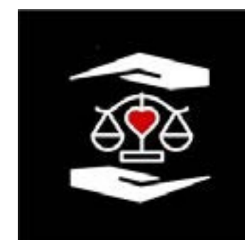
ASSOCIATION A.M.O.U.R. DE LA JUSTICE

L'association Victimes et Avenir, le Collectif Justice pour les Victimes de la Route, la Caisse Nationale d'assurance Maladie, la D.I.A.V. (délégation interministérielle d'aide aux victimes), avec le concours d'avocats spécialisés, de médecins conseils de victimes et l'association A.M.O.U.R. de la Justice.