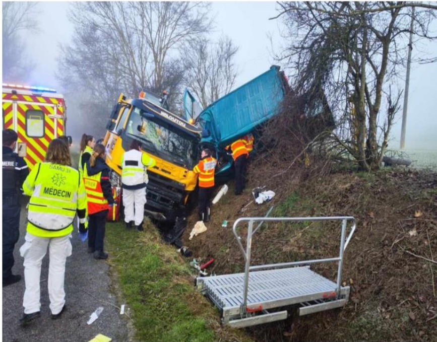
De très gros moyens de secours sont déployés sur un accident de la route qui s'est produit à Lanta, ce mardi 4 février au matin.