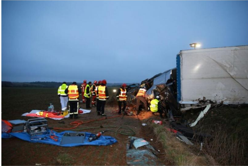
Un accident de la circulation impliquant un poids lourd s'est produit ce jeudi 6 février 2025 sur la RN20 à hauteur d'Étampes.